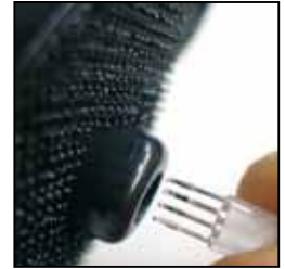
Push & Pull LEDs CHAMELEON