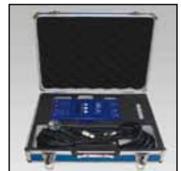
Controller Kit / Kit de commande