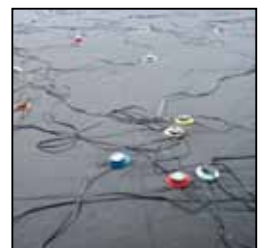
Velcroscheiben / Rondelle velcro / Velcro Washers