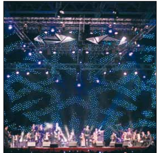
Mawazine Festival 2009, Marocco