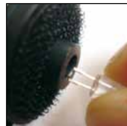
Push & Pull LEDs CLASSIC