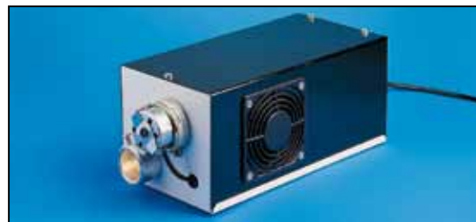
Lichtquelle / Source lumineuse / Illuminator