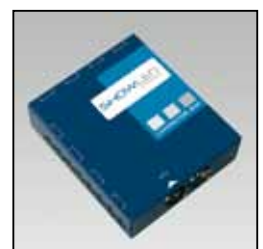
Connector Box / Boîtier de connexion