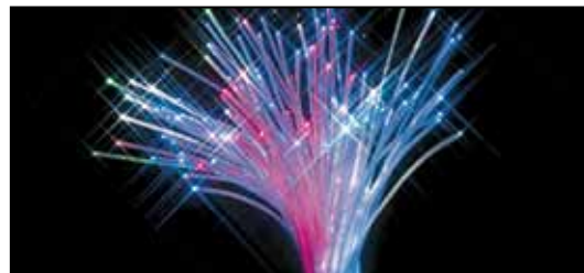
Glasfasern / Fibres de verre / Glas fibres