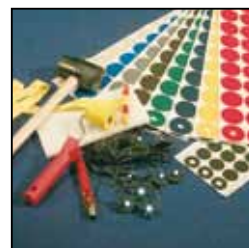
Werkzeug-Kit / Kit outils / Tool Kit