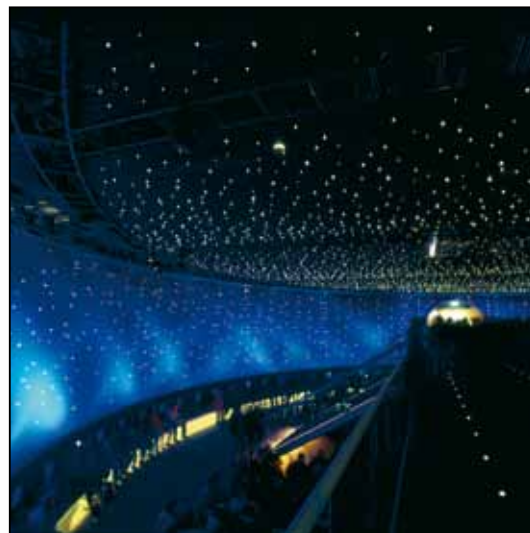
IAA Frankfurt VW Messestand / Stand VW / VW exhibition 2001

For latest product details please see the respective online data sheet.