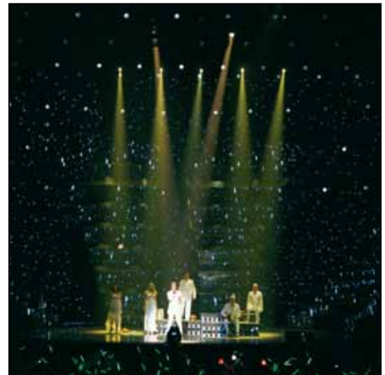
Eurovision Song Contest 2006, Athens