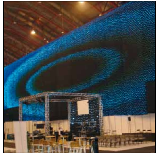
PLASA London 2007