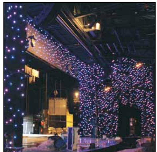
Royale Palace Kirrwiller 2008