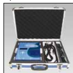
Controller Kit / Kit de commande